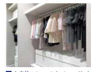
4 大容量のウォークインクローゼット 5 2ドア1ルームの洋室 主寝室に大容量のウォークインクローゼット。季節 物の衣類をまとめて収納できて便利です。

リビングは勾配天井の開放的な空間。庭に面し た大開口の窓から明るい陽射しも差し込みます。