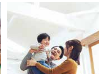
3 開放的なリビング空間 リビングは勾配天井の開放的な空間。庭に面した大開口の窓から明るい日差しも差し込みます。