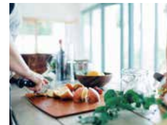
2 2wayのキッチン動線 2wayのキッチン動線。キッチンで料理をしながら洗面室で洗濯を並行してできるなど、家事がはかどります。