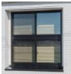
セットバックした 彫りの深い窓