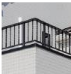
ロートアルミ格子