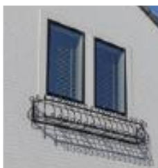
ロートアルミの フラワーボックス