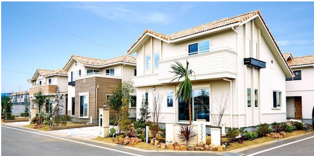
ウィザースガーデン袖ヶ浦街並／平成28年1月撮影

「ウィザースガーデン袖ヶ浦」は、南欧風の外観が建ち並ぶ、統一感のある美しい街並みを形成する全51棟の新築一戸建てプロジェクト。快速停車駅でもあるJR内房線「袖ヶ浦」駅まで徒歩5分という好立地をはじめ、東京湾アクアラインにより都内や横浜、羽田方面へのアクセスも良好で、さらに周囲にはスーパーやアウトレット、学校、病院、大型公園などの生活利便施設も充実しており、子育て家族に優しい理想の住環境が整っています。