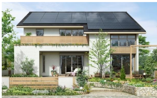
掲載のCGは図面をもとに描き起こしたものであり一部オプション等を含みます。

※1) 「全量買取制度(再生可能エネルギーの固定価格買取制度)」を活用した、S-36タイプ・3LDKプラン(延床面積36.06坪)の20年間・固定価格での売電収入見込額です。売電収入見込み額は、買取単価29円/kWh(平成27年に4月1日～平成27年6月30日)に消費税8%にて算出しております。立地や敷地環境、設置方位、日照条件等により異なりますので、必ずしも売電収入見込額を保証するものではありません。また、土地により法的な建ぺい率・高さ・採光の制約を受け、参考プラン通りに建設できない場合がございます。なお、買取単価29円/kWhの適用には条件がございます。